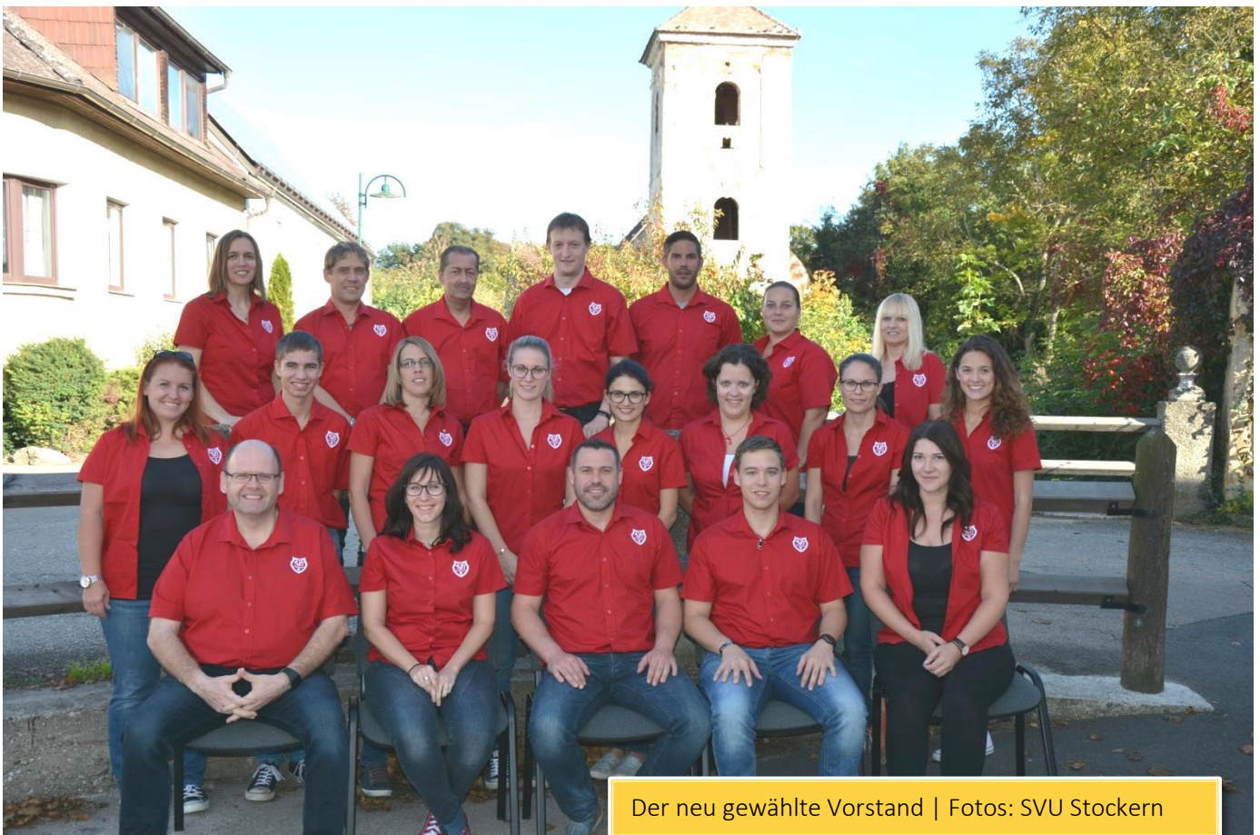
Der neu gewählte Vorstand