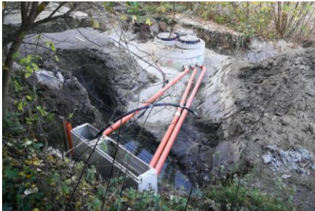
Für die Abwasserbeseitigung musste ein neues Pumpwerk (Foto oben) errichtet werden, das mit dem Anschluss des ersten Gebäudes in Betrieb genommen wird.

Die ersten Bauwerber haben bereits mit dem Bau ihres Eigenheimes begonnen.